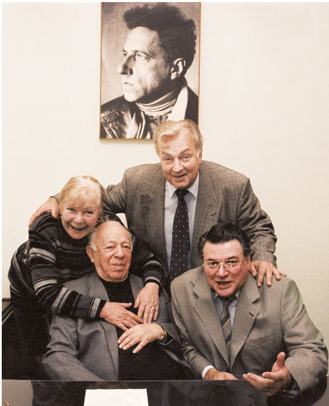
С Ольгой Аросевой, Валентином Плучеком и Михаилом Державиным

лизма нет, а есть только необходимость все время ориентироваться на 90-летнюю жизнь этого заведения и стараться быть (конечно, изображая это) патриотом.