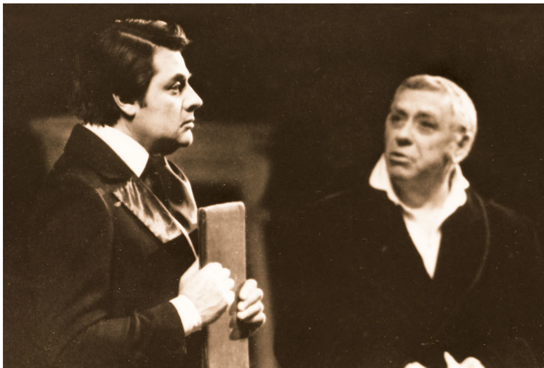
С Анатолием Папановым в спектакле «Горе от ума»

Часто на творческих вечерах, когда и Державин, и Миронов были на основной сцене, я делил площадку с Анатолием Папановым. Мы не играли с ним вместе – мы сосуществовали: отделение – он, отделение – я. Всегда поражался какой-то прямо-таки звериной отдаче Папанова на сцене. Маленький, занюханный провинциальный клубик или сцена Дворца съездов – одна и та же запредельная мощь и стопроцентное «отоваривание» зрителя.